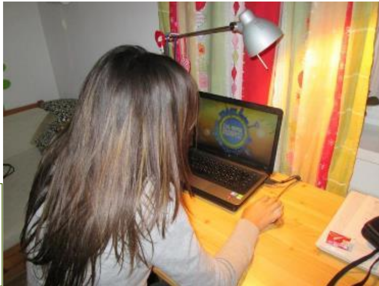
Saját szoba, saját laptop